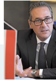
Heinz-Christian Strache Vizekanzler und Bundesminister